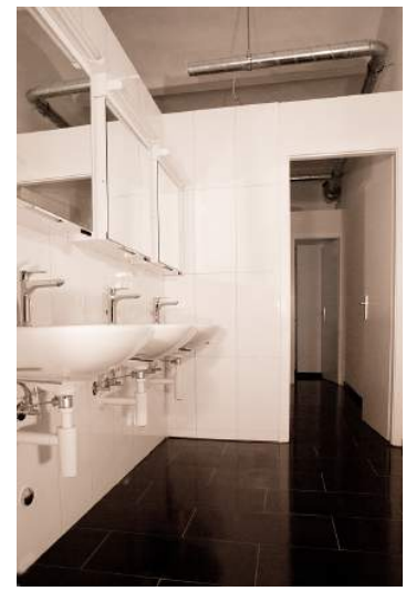
Freitag-Abend, 8. August: Die Anlage ist fertiggestellt!