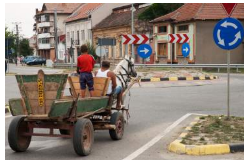
Ein Junge verkauft Pflirsche, eine ehemalige Discothek und auch Pferdefuhrwerke im vielbefahrenen Kreisel.