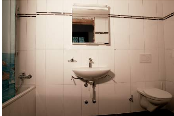
Einbau Badezimmer im Erdgeschoss