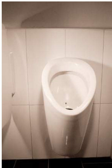
...und die Buben.