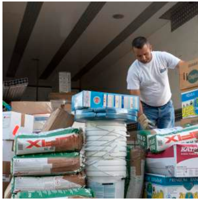
Ob da noch was Platz hat?