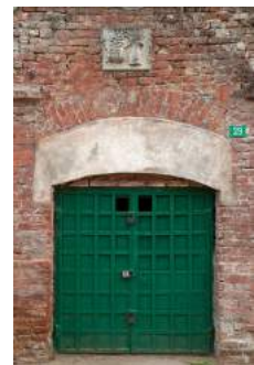
Grosse Teile im und um das Schloss sind unterkellert. Sehenswert sind die Weinkeller, zumeist um das Jahr 1790 gebaut.