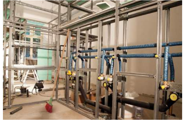
Donnerstag, 31. Juli: GIS-Systeme aufgebaut