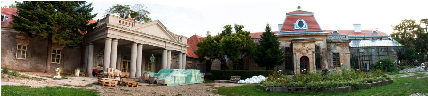
Kinderheim in Székelyhíd/Sacueni, Rumänien