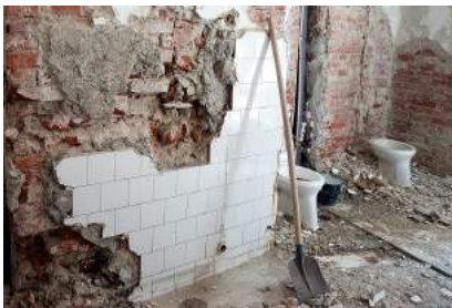
In diesem Zustand erhält die Schule die Liegenschaft zurück.

Sie koordiniert u.a. die Rückgabe von Immobilienanteilen zwischen Staat und dem GERHARDINUM. Das Bistum unterstützt die Schule ideell und finanziell. Nebst bedeutenden Beiträgen für die vielen Renovationsarbeiten trägt das Bistum etwa einen Drittel an die Betriebskosten bei. Ihr grösster Wunsch ist es, dass der Jugend die Werte einer christlichen Lebensauffassung positiv vermittelt werden können.