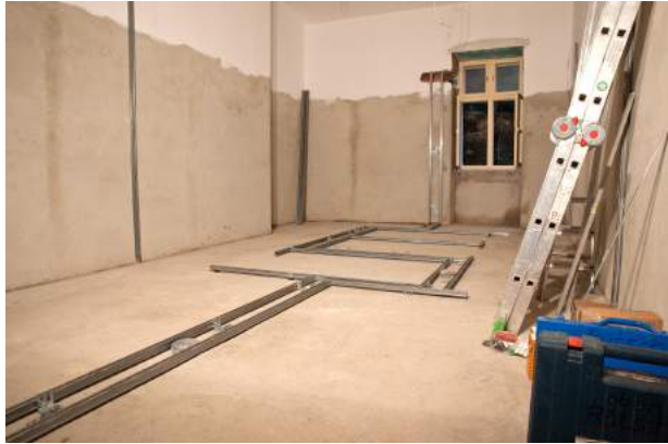
Sonntag, 27. Juli: Vorarbeiten beendet