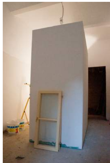
Dienstag, 5. August: WC-Kabinen erstellt und verputzt