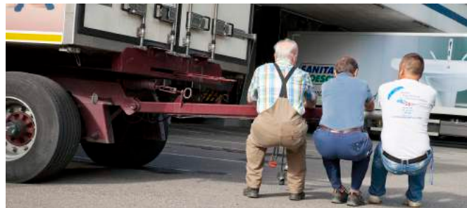
Selbst drei starke Männer genügen nicht, um die Deichsel in die richtige Position zu bringen.

Dritte Ladestation ist bei Camion Transport AG, Schwarzenbach, die Lagerfläche zur Verfügung gestellt haben.