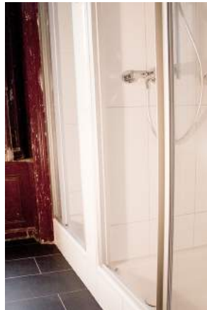
WC und Duschen für den Kindergarten im Erdgeschoss