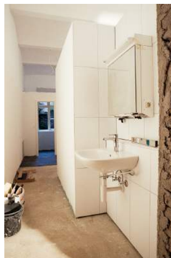
Mittwoch, 6. August: Sanitär-Apparate montiert