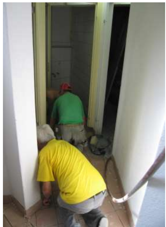
Vor dem Ausfugen der Bodenplatten ist Grossreinigung der Fugen angesagt.