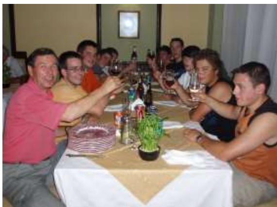
Gemütliches Abendessen nach harter Arbeit.