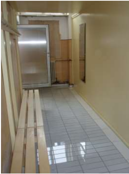
Fertige Mädchen-Garderobe mit Metall-Türe zum Duschenraum, Bänken und grossen Spiegeln.