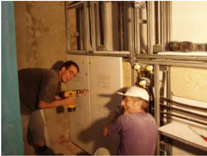
Die Doppel-Duschenwand mit allen Wasserleitungen wird mit Geberit Aquapaneel Plus beplankt.