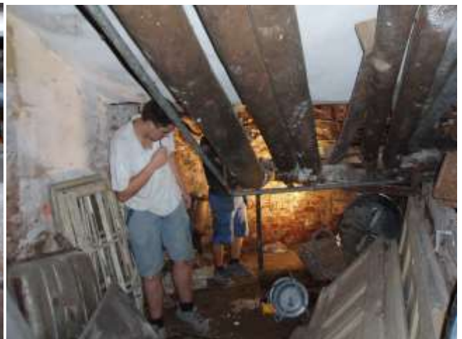
In den "Katakomben", der Unterwelt des Gebäudes müssen die Zuleitungen total neu erstellt werden.