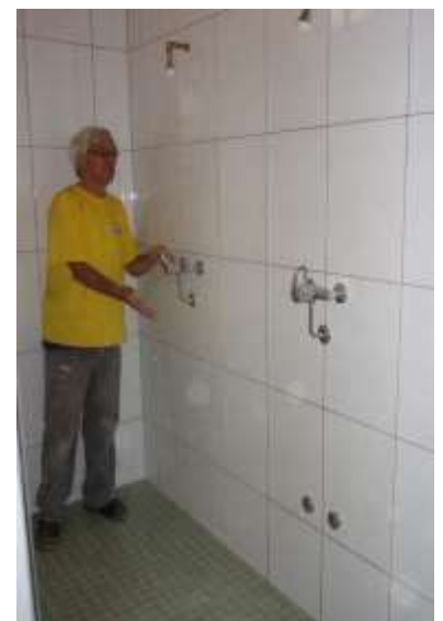
Perfekte neue sanitäre Einrichtungen, sei es in Garderoben, Toiletten oder Duschen!