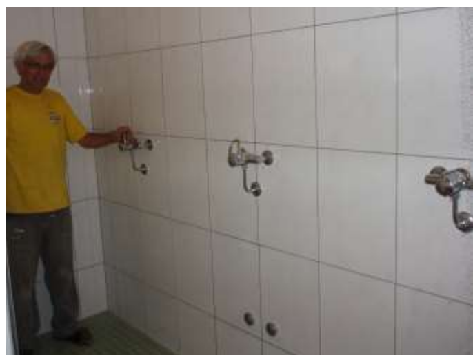
Komfortable Bedienung der grosszügigen Duschen.