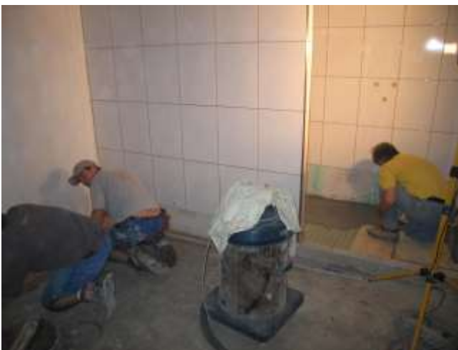
Vorarbeiten zum Verlegen der keramischen Bodenplatten in der Knaben-Garderobe.