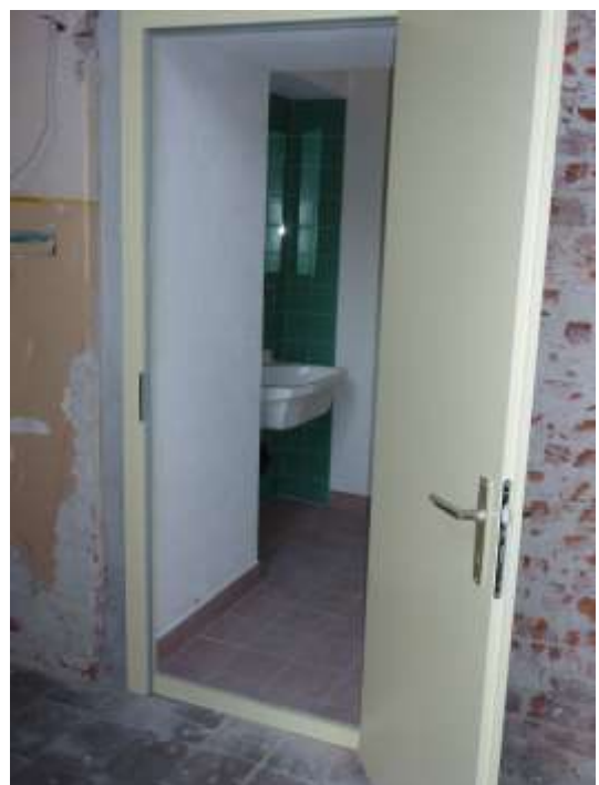
Eingangstüre zur Knabengarderobe.