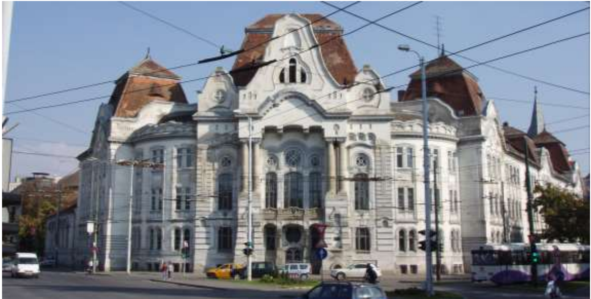
Das Gymnasiumsgebäude ist ein riesiger Komplex, der aus Distanz sehr ansprechend aussieht.

durchgeführt wurden, galt es diesmal einem initiativen Schulleiter zu helfen. Dabei standen wieder besonders die Anliegen der Jugendlichen im Vordergrund.