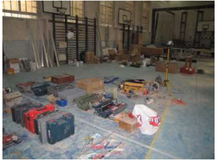
Übersichtliche Auslegeordnung von Baumaterial, Werkzeug und Maschinen in der Turnhalle.