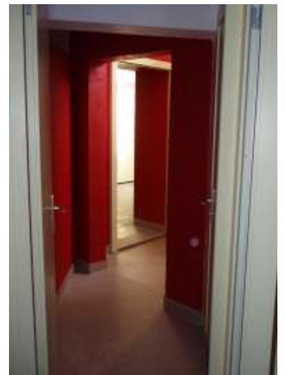
Eingangsbereich zu den WC.