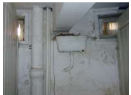
Alte sanitäre Einrichtungen für den Sport-Unterricht vor der Turnhalle.

Ehemalige Duschanlagen, welche wir sanieren werden.