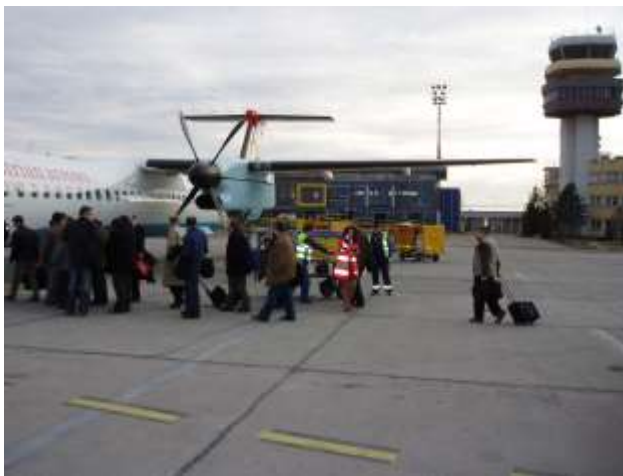
Abflug vom Flughafen Timisoara.

Nachdem das Gros abgereist war, wurden die Werkzeuge und Maschinen wieder in den Van gepfercht und zu dritt erreichten auch wir nonstopp unser zu hause.