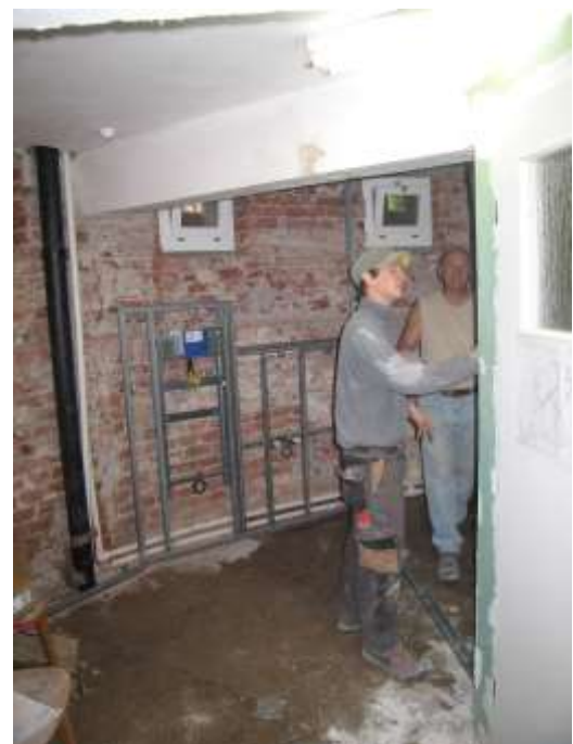
Die neuen Fenster sind montiert, jetzt wird mit der GIS-Vorwandmontage begonnen.