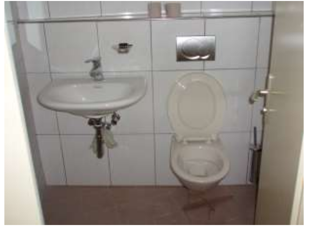
Das neue Mädchen WC