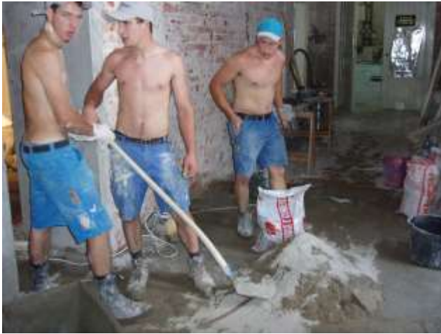
Zubereitung des Pflasters für die Unterlagsböden..