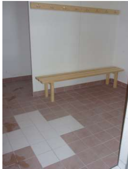
Das Schweizerkreuz im Boden der Knaben-Garderobe erinnert an die Ersteller dieser sanitären Anlagen.