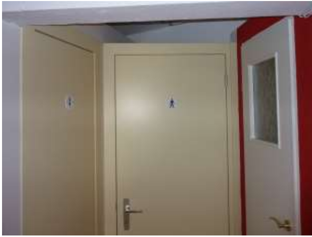
Fertiggestellter Eingangsbereich WC Mädchen und Knaben und Technikraum