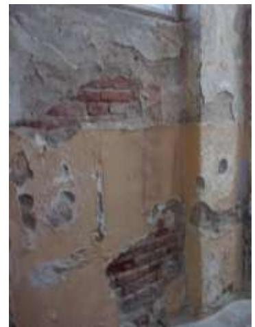
Beim näheren Hinsehen ist es jedoch nach unseren Begriffen eher ein Abbruch-Objekt.