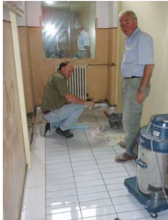
In der Mädchen-Garderobe sind die Wände schon montiert und die Bodenplatten werden ausgefugt.