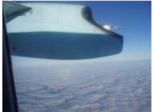
Über den Wolken zurück in die Heimat.