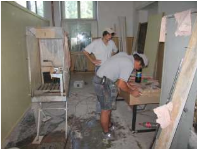
Grossandrang bei Beny, der zuständig ist für Spezialmasse bei Keramik-Plättli-Zuschnitten.