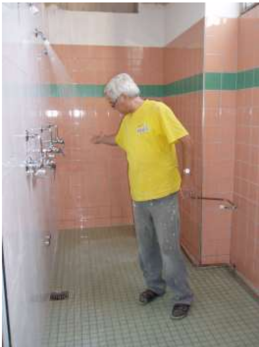
Und es funktioniert !