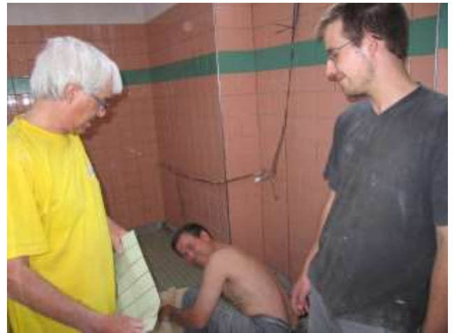
Verlegen der Mosaik-Platten am Duscheboden mit Gefälle zum Geberit-Bodenablauf.