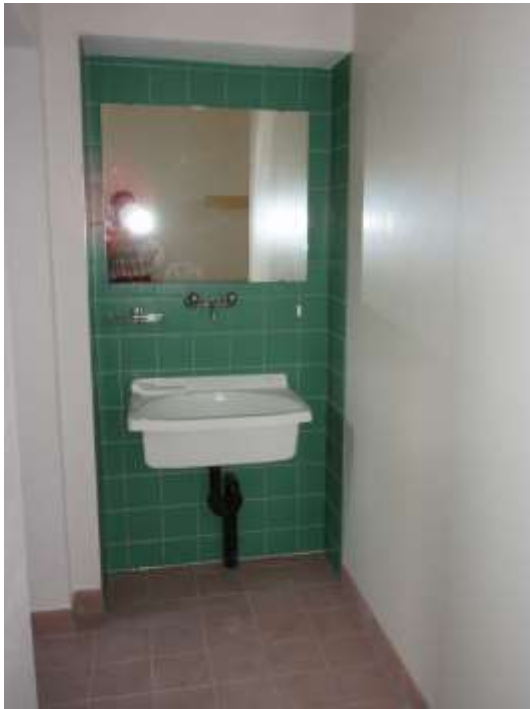
Waschtrog für die Putzfrauen, damit der Unterhalt unserer neuen Anlagen langfristig gewährleistet bleibt.