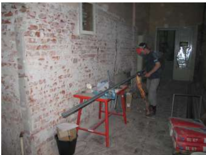
Vorbereitung der Geberit GIS-Rahmen.