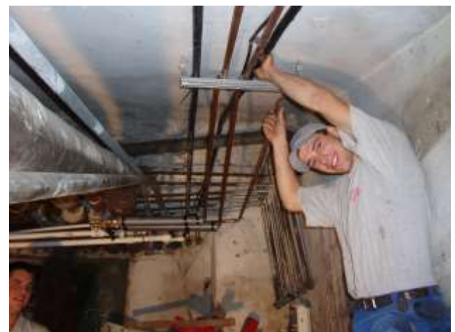
- Aber perfekt gelöst!