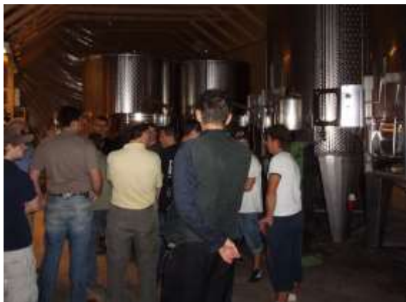
Interessante Einblicke in die Kellerei Bayard.

heimes, von Rebbergen, Keltereien, Discos, rumänische Familien waren ebenso eindrücklich wie die Weinkostproben bei einem Schweizer Weinbauern und Unternehmer, oder das original ungarische Gulasch. Sogar der Herr Bischof lud uns zweimal zu kulinarischen Köstlichkeiten ein.