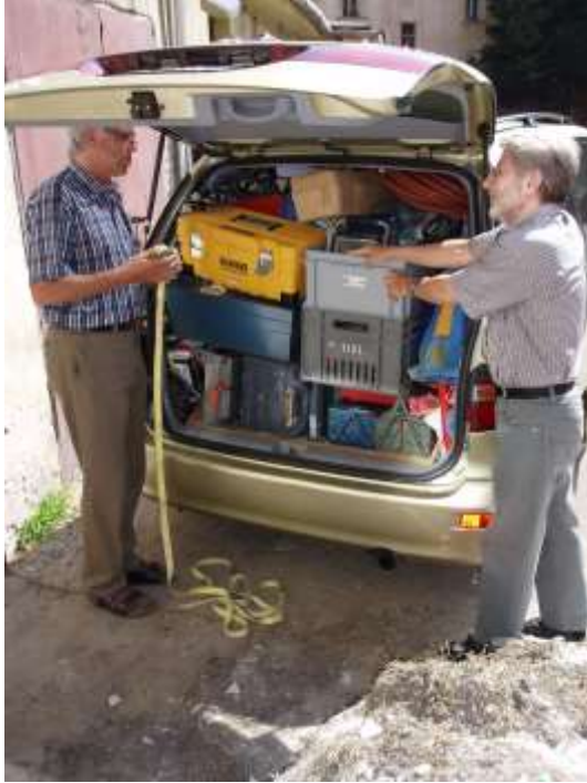
Voll bepackt mit Werkzeug und Maschinen.

Die Beschaffung vor Ort wäre aus zeitlichen und qualitativen Gründen unmöglich. Die Maschinen und Werkzeuge fuhren wir mit dem Van direkt auf die ferne Baustelle. So konnten die 9 Lehrling und 6 Arbeiter sofort mit Vollgas mit der Arbeit beginnen.