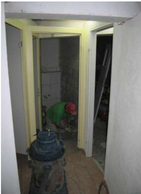
Die Zeit drängt, doch die Arbeit geht dem Ende entgegen.