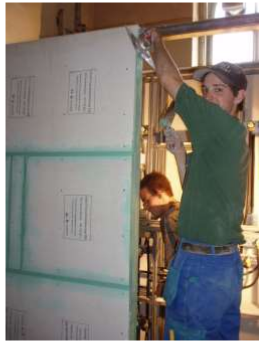
Ausfugen der Trennwand zur Knaben-Garderobe