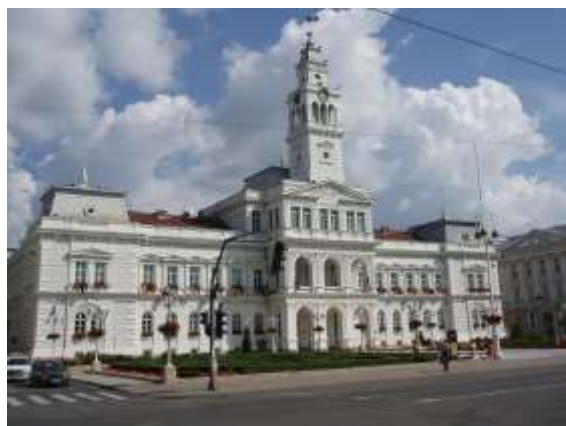
Sehenswürdigkeiten (Rathaus) in der Stadt Arad.