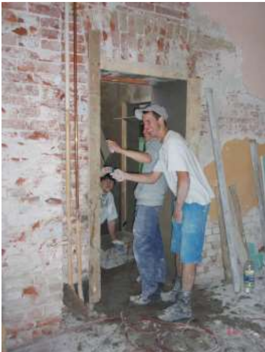
Das Verputzen der Türleibungen macht offensichtlich Spass.