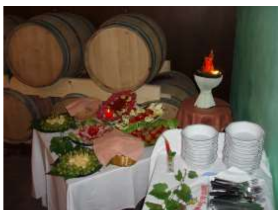
Rumänische Spezialitäten warten auf uns.