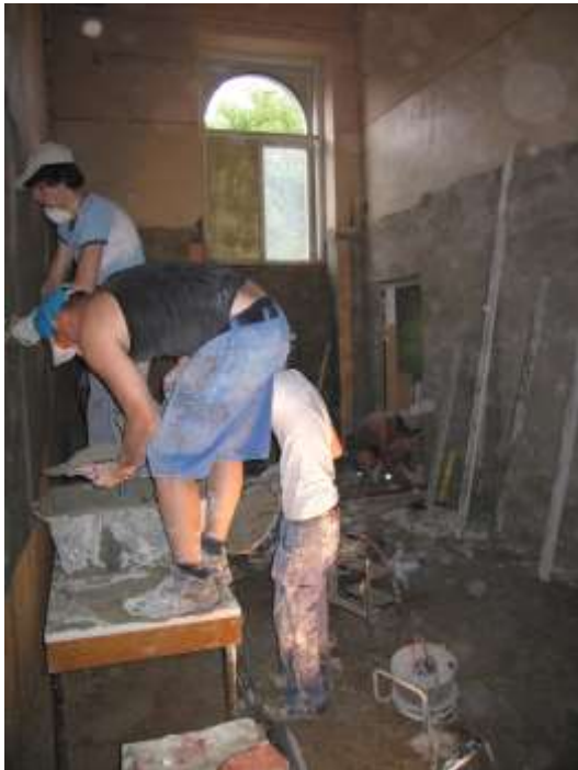
Strenge Verputzarbeiten an den Wänden.