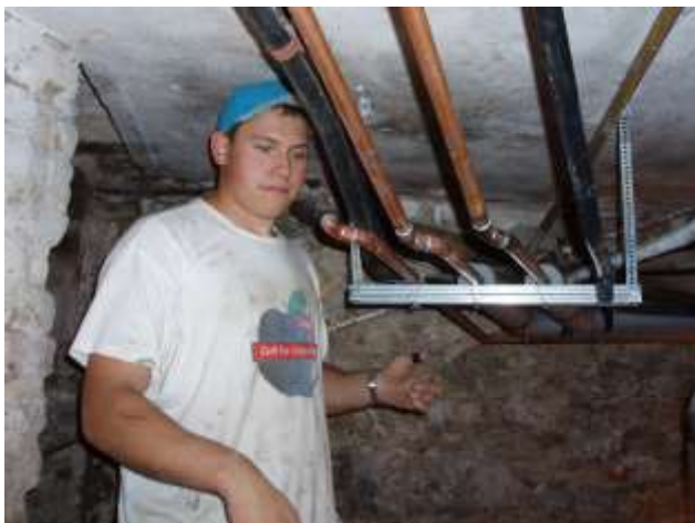
Eine knifflige Arbeit bei so vielen Schrägen und Steigungen!