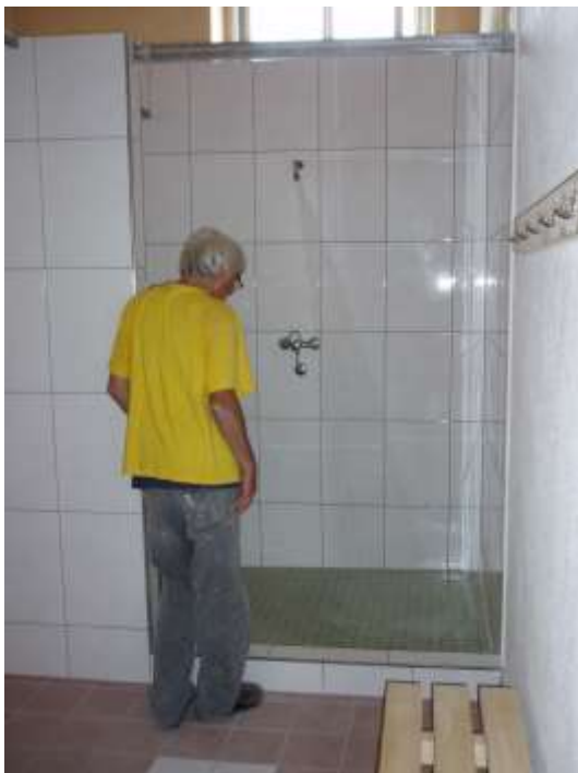
Von der Knaben-Garderobe in die Duschanlage.