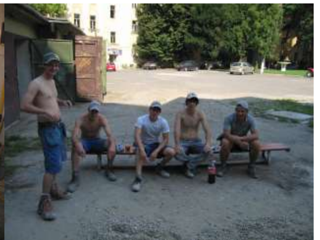
Die wohlverdiente Zvieri- und Zigarettenpause.