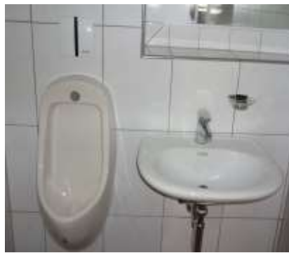
Pissoir und Waschtisch im Knaben-WC